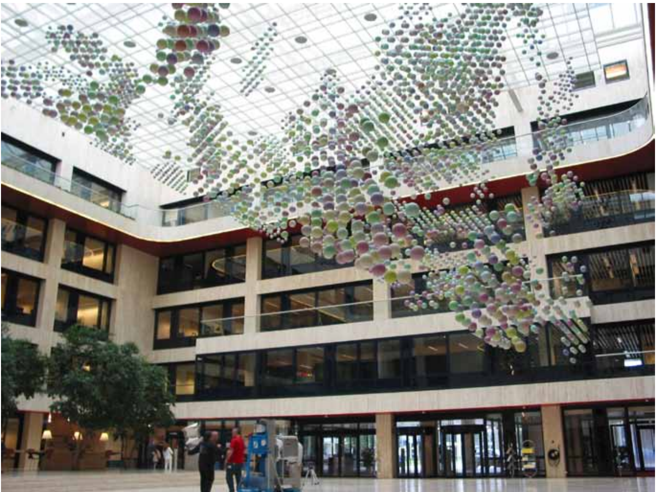
Driedimensionale kleurstructuur in de hal van het hoofdkantoor van AEGON 1983-1986